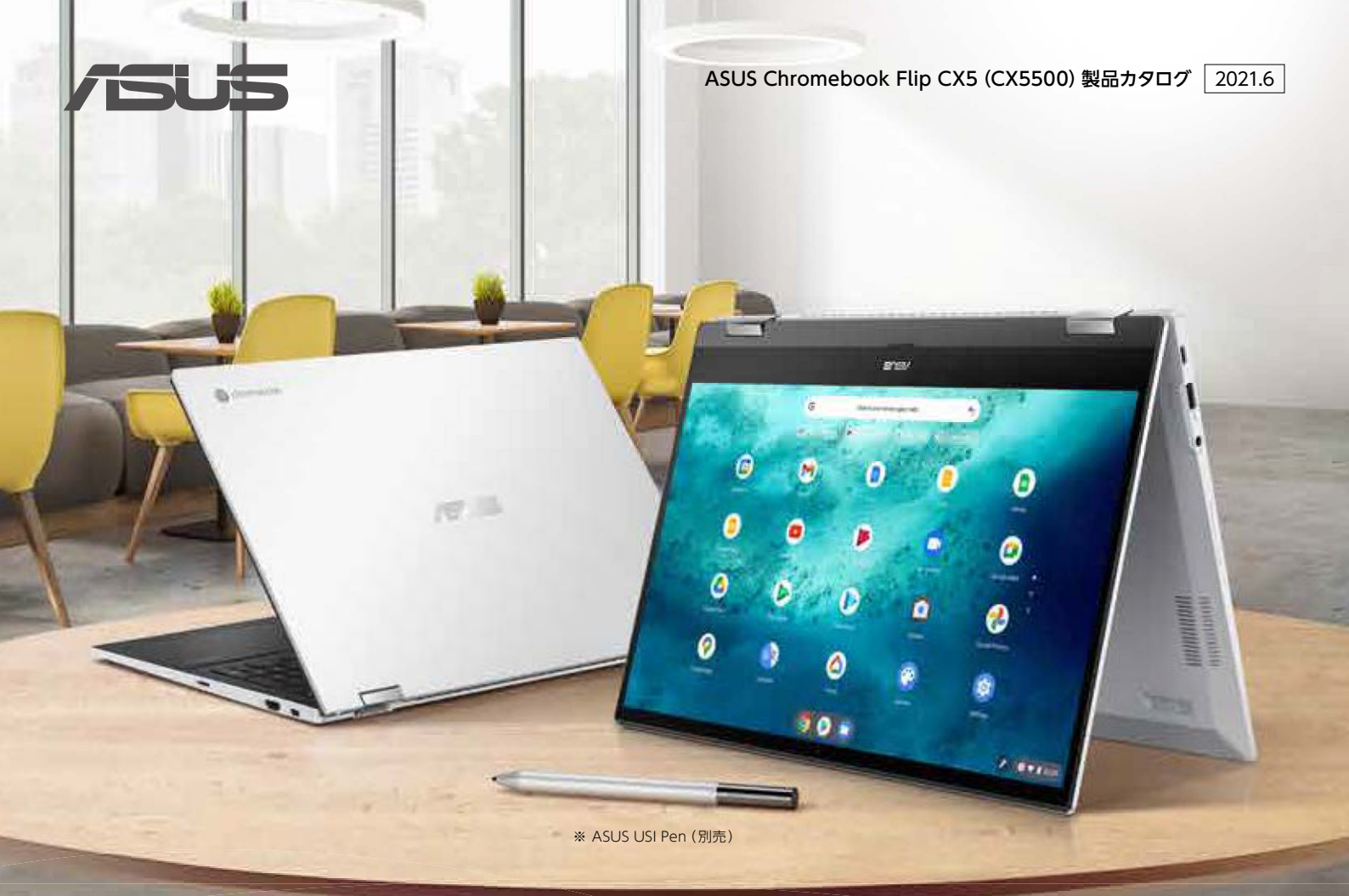
※ ASUS USI Pen (別売)